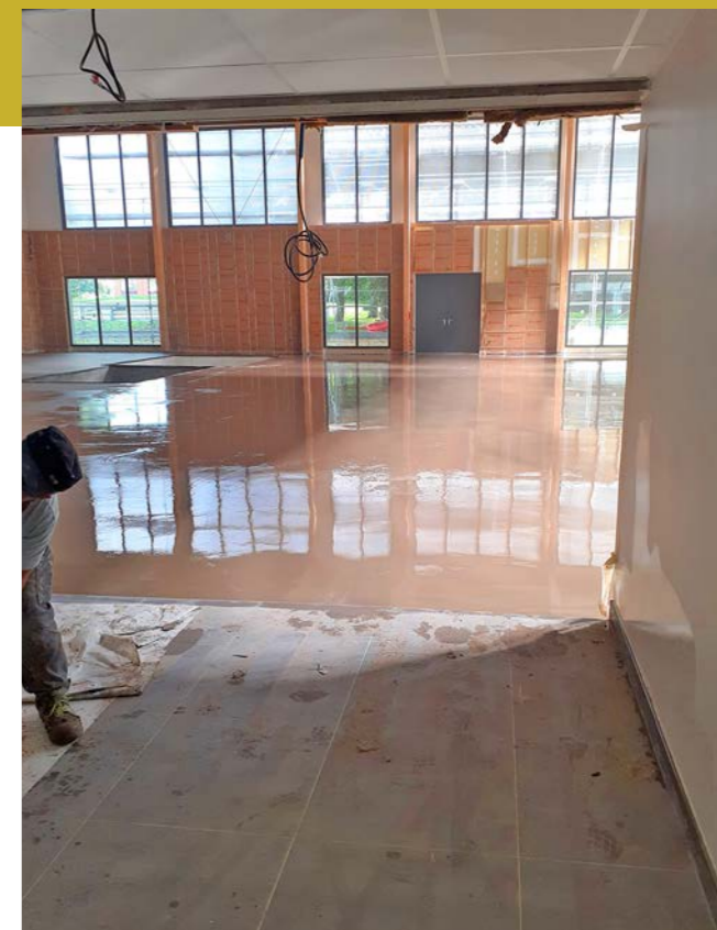
Ragréage de l'extension

Dans quelques semaines, les gymnastes de Chevry-Cossigny pourront s'entraîner dans la nouvelle salle du complexe multisports dont les travaux ont été financés par la Communauté de communes de l'Orée de la Brie. Ce nouvel espace dédié à la gymnastique fait 503 m 2 et est équipé de vestiaires, de sanitaires, de rangements et d'un bureau. La CCOB leur souhaite une très belle saison sportive !