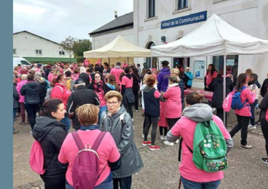
Le village rose, sur le parvis de la CCOB.

Brie-Comte-Robert, Chevry-Cossigny, Servon et Varennes-Jarcy : toutes solidaires !