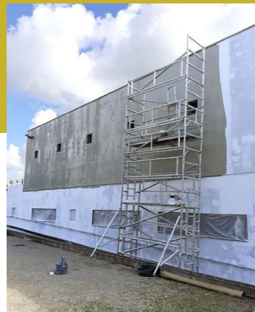
Ravalement du complexe multisports